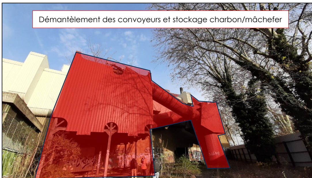
Démantèlement des convoyeurs et stockage charbon/mâchefer

Les bardages métalliques et couvertures bac acier vont être déposés. Les zones concernées sont les suivantes :