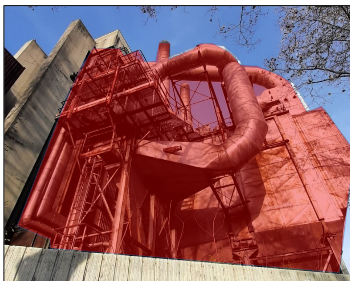
Démantèlement de Unité de traitement des fumées